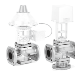
配气动及电动执行器的 VG8000N 系列阀门